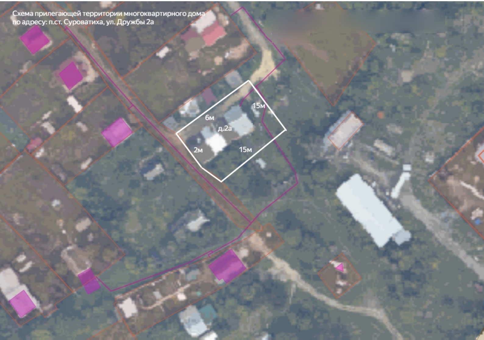
Схема прилегающей территории многоквартирного дома по адресу: п.ст. Суrowатиха, ул. Дружбы 2а